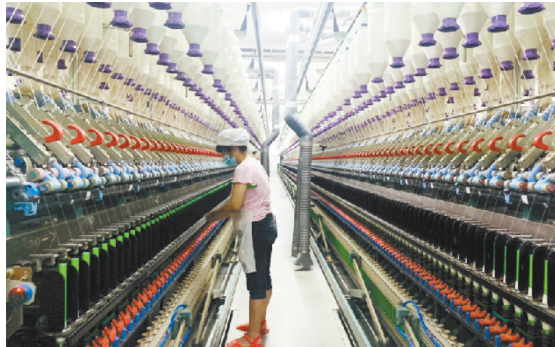
扶沟县昌茂纺织有限责任公司智能化纺纱车间。