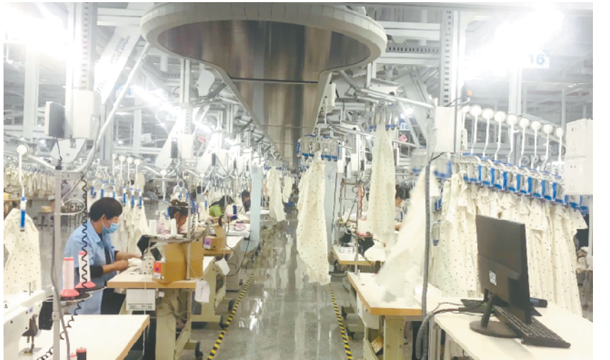
河南阿尔本制衣成衣生产车间。

潮平两岸阔，风正一帆悬。沐浴着新时代的朝阳，周口纺织服装产业这艘巨轮，正破浪前行！②5