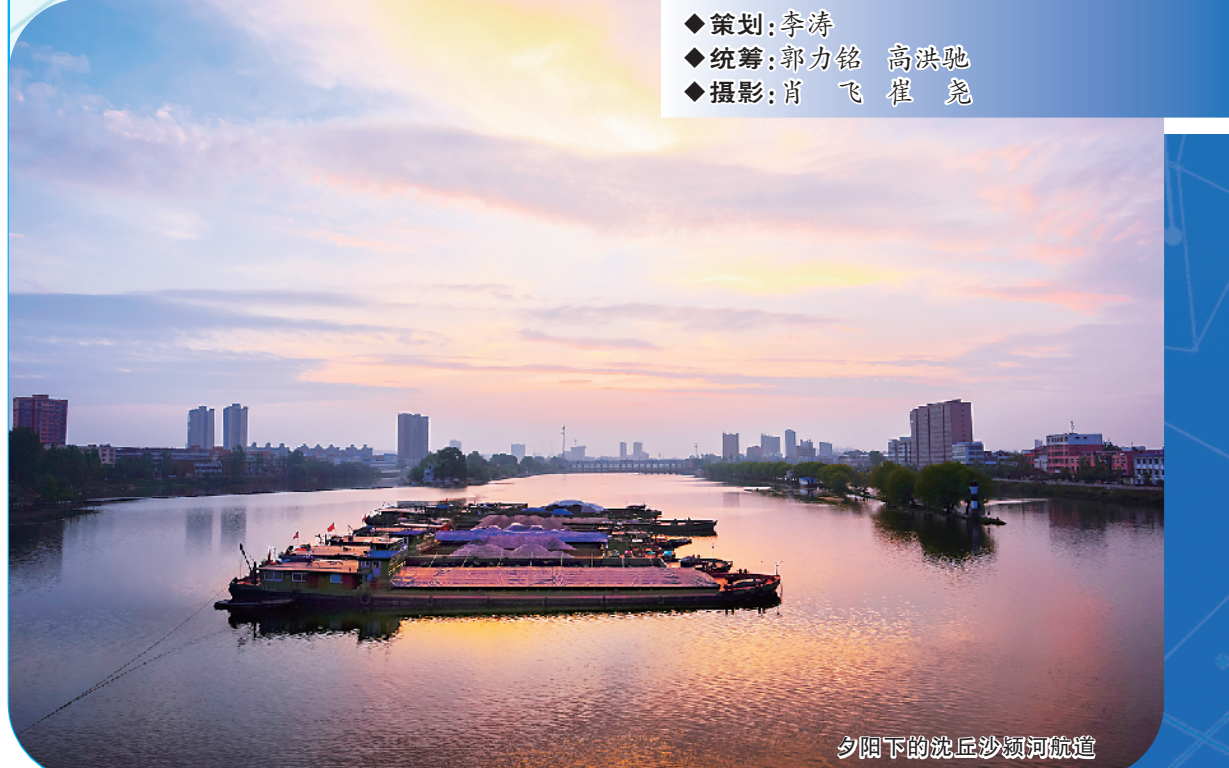
夕阳下的沈丘沙颍河航道