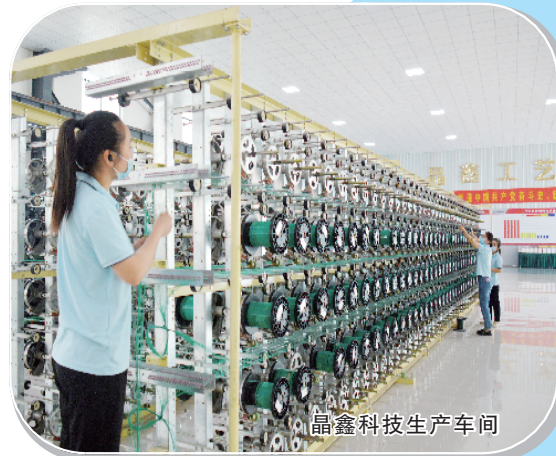
晶鑫科技生产车间