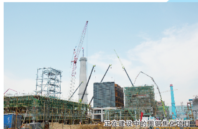
正在建设中的周钢焦化项目