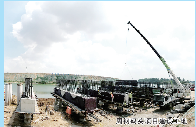
周钢码头项目建筑工地