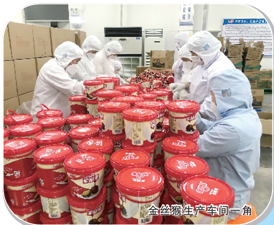
金丝猴生产车间一角

沈丘县委书记田庆杰表示,将坚决按照市委、市政府决策部署,围绕建设“美丽大花园、幸福新沈丘”的目标,坚定信心、高位思维、超前谋划、创新驱动、数字赋能,持续推进钢铁、食品、装备制造三大主导产业发展,继续开展“三个一批”,稳住经济盘,打好发展牌,切实做好“六保六稳”工作。继续落实“双督双查双评”制度,树立“干与不干不一样、干快干慢不一样、干好干坏不一样”的鲜明导向,坚决把沈丘建设成体现河南美好生活、展示河南出彩形象,在豫皖两省边际有重要影响和美誉度的现代化中等城市。