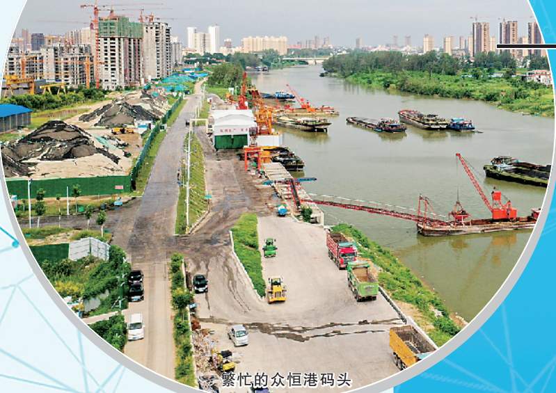
繁忙的众恒港码头