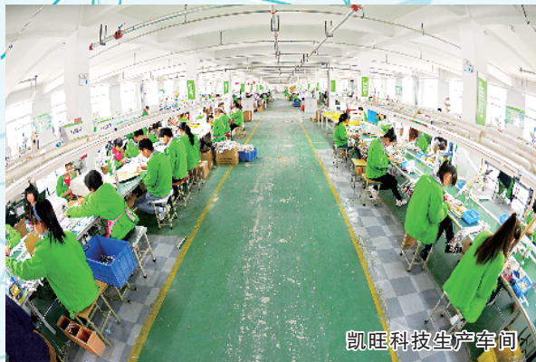
凯旺科技生产车间

今年以来,沈丘县全面贯彻落实国务院和省委、省政府稳住经济大盘会议精神,按照市委、市政府“两个确保”“十大战略”工作部署,坚持“产业兴县、工业强县”,统筹疫情防控和经济发展,在项目建设中,高位谋划,快速推进,着力推动钢铁企业延链、补链、强链,打造“钢铁新城”;瞄准高端择商选资,发展临港经济,积极推进港口物流园区和港口码头通用泊位建设,加快枢纽港和沙颍河航道升级改造进度,完善“公铁水”立体互补运输链条,实现钢、港、产、园、城深度融合的临港经济发展新模式,打造豫东南皖西北最大的港口物流链。