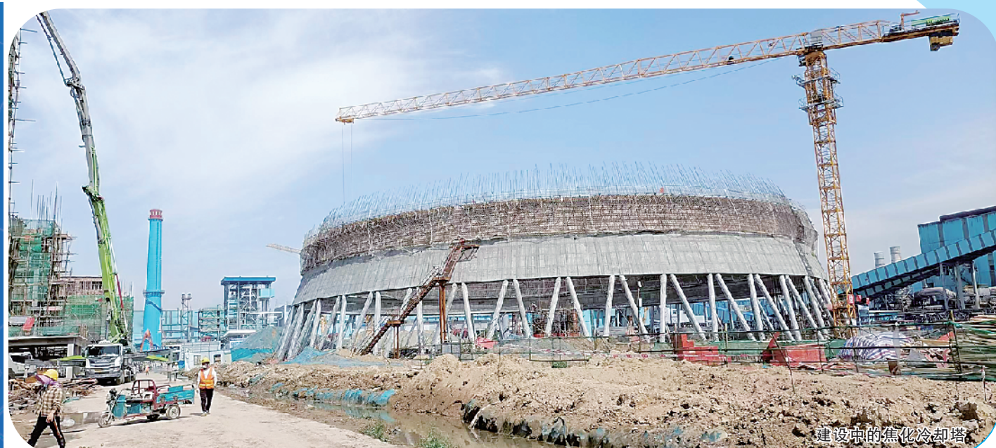
建设中的焦化冷却塔