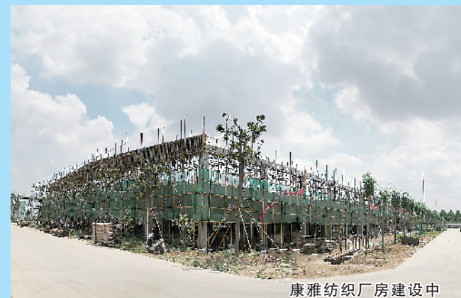
康雅纺织厂房建设中