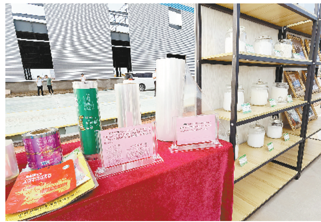
鑫塑新材料 CPP 膜建设项目