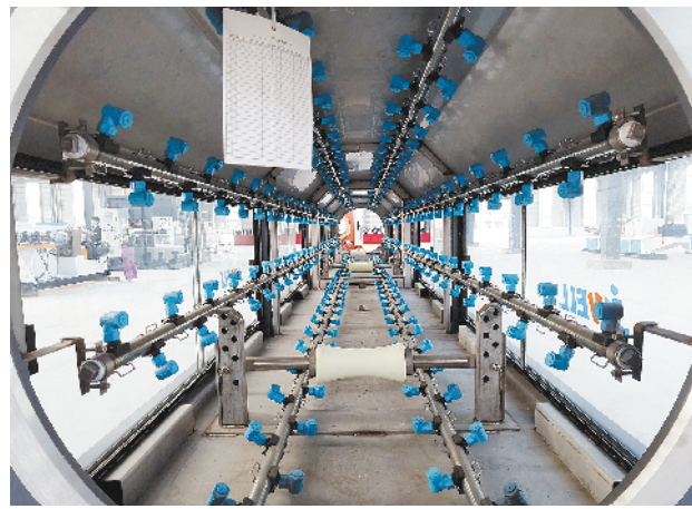
河南怀皓新材料管件套道建设项目