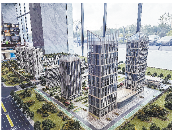
昌建 MoCO 湖畔国际项目