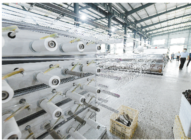
瑞云塑业建设项目