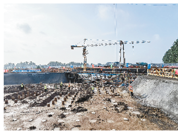
周口高新区工业邻里中心项目