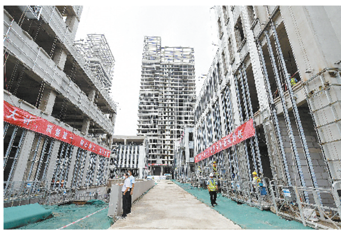
周口数字经济产业智慧岛项目