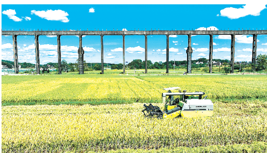
湖南常宁:抢收中稻

公安部指出，“百日行动”开展以来，各级公安机关重拳打击突出违法犯罪，铁腕整治社会治安乱象，攻坚化解各类安全隐患，全面净化社会面环境，打出了声势，震慑了犯罪，赢得了民心。要加大抓落实力度，保持“百日行动”强大声势和凌厉攻势。要加强统筹协调，强化督察问效，抓好专项行动协调推进。要坚持严格规范公正文明执法，严格队伍管理，落实爱警措施，不断鼓舞士气、激发斗志。