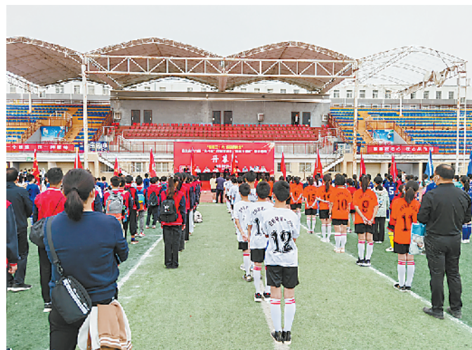
商水县体育运动开展如火如荼