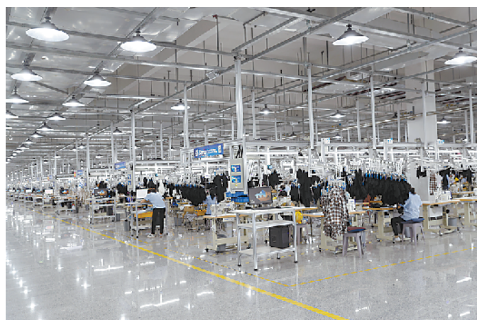
河南阿尔本现代化生产车间

必须坚定不移抓党建、固根本。扛起管党治党政治责任,深入推进新时代党的建设伟大工程,以开展“能力作风建设年”活动和“五星”支部创建为抓手,夯实组织体系,建强基层堡垒,推进廉政建设,让政治生态更加风清气正。