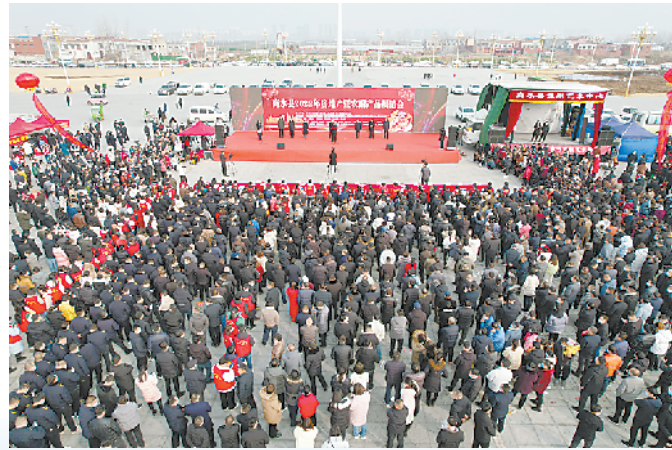
商水房地产暨农副产品展销会激活消费潜力