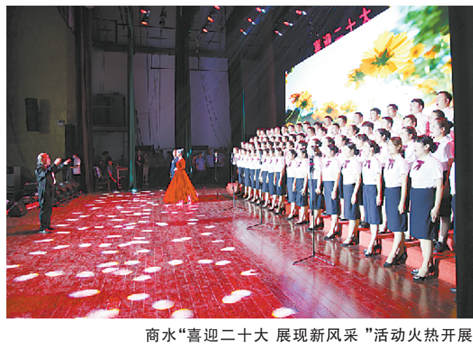
商水“喜迎二十大 展现新风采”活动火热开展