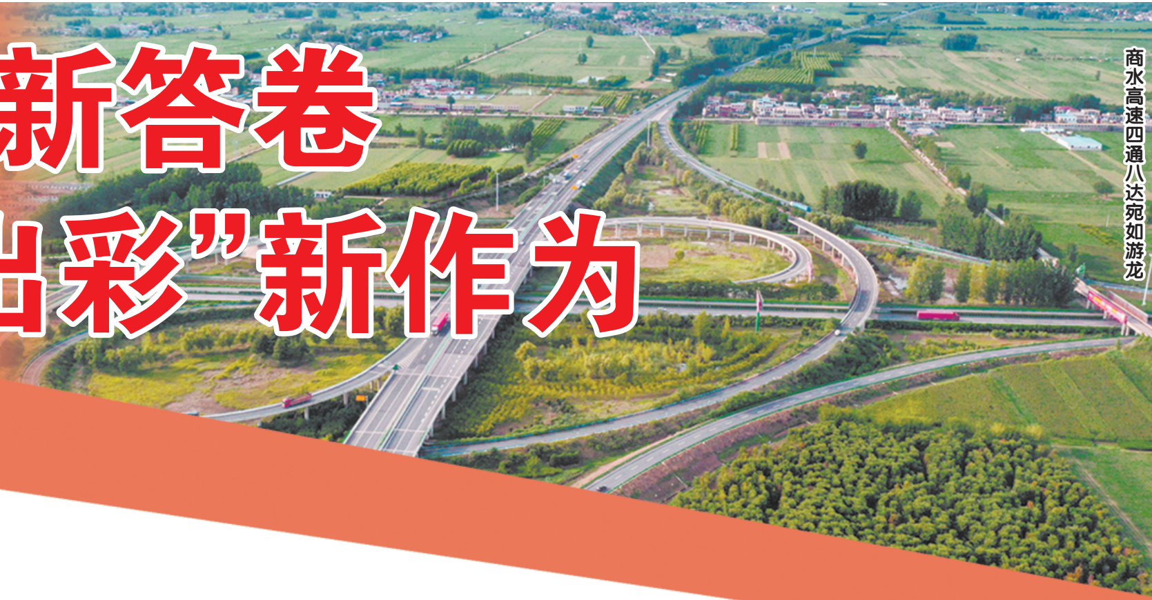
商水高速四通八达宛如游龙