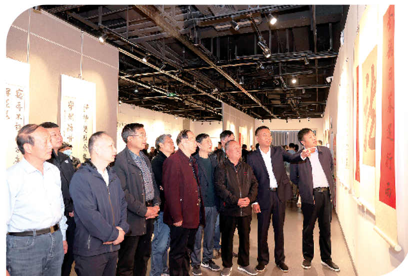
参会人员认真观赏讨论丁谦书法艺术

以钢笔为主的日子过了十年,丁谦并没有放下笔墨。随着年龄增长,他有意地重新把重心转向毛笔。他细细研究米芾、苏东坡、孙过庭、董其昌,从理论到作品,广收博取。经过不懈努力,丁谦在书法界声名鹊起,任中国书法家协会理事、中国硬笔书法协会副主席、中国榜书研究会副主席、中国宋庆龄基金会理事、中日韩书画联谊会副会长等职。