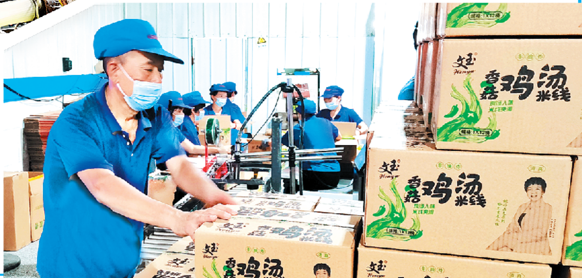
8月4日，记者在郸城县高新区看到，博欣生物、文玉食品、豫树食品等中小企业的产品，通过电商直播销往全国，小食品做成了大产业，年产值近10亿元。(2)10