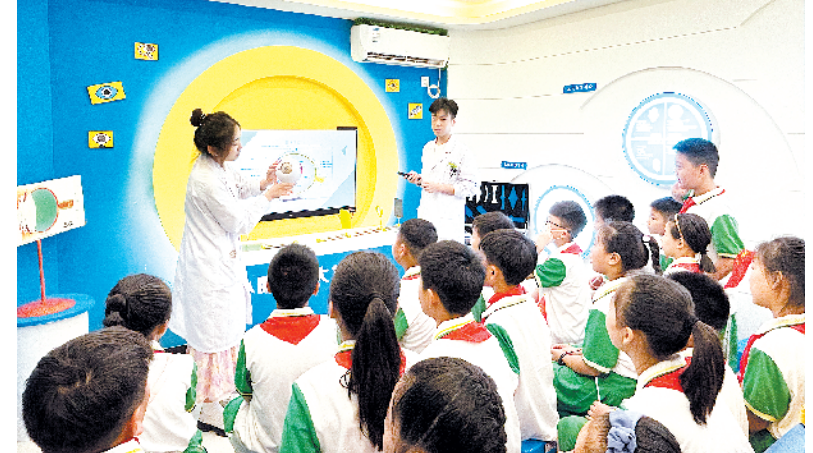
为进一步增强全市青少年自护意识和能力，培养青少年爱眼护眼的良好习惯和视力防控意识，8月2日，共青团周口市委联合市眼科医院开展“青春自护‘豫’你同行”青春(红领巾)寻访活动。图为五一路小学的少先队员们在市青少年近视科普基地参观。(2)18