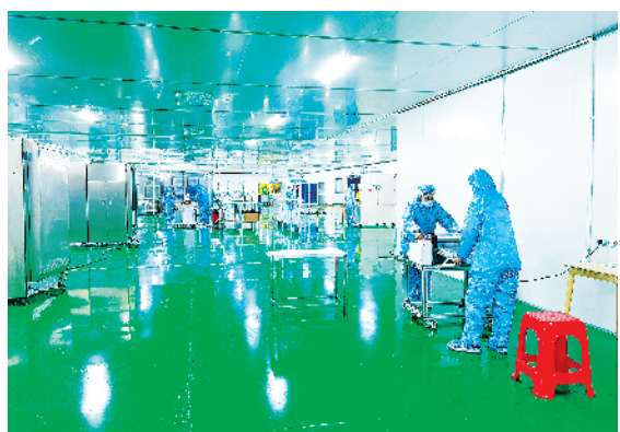
周口云显光电科技有限公司光电一体化全产业链生产项目。