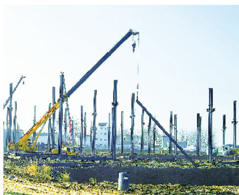
中玻玻璃年产300万平方米低碳结构玻璃新材料生产线项目。

该项目计划投资3亿元,年产5000吨特种不锈钢制品、建筑用品。目前,项目1号厂房已建成,研发楼主体结构已完工,3号、4号厂房钢结构框架已搭建。项目建成后,预计年产值4亿元,年纳税约3000万元,可安置就业近150人。②15