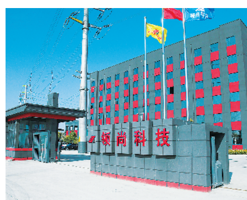
领尚科技航空装备制造产业园特种材料项目。