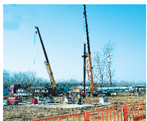
周口海盛生物科技产业园项目。