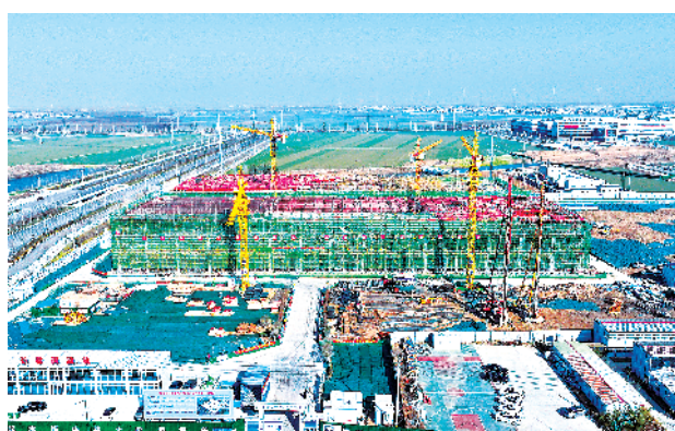
周口电子信息智能终端产业基地二期项目。