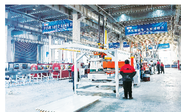
河南森塑塑料制品有限公司年产10万吨UPVC(科创产业园)项目。