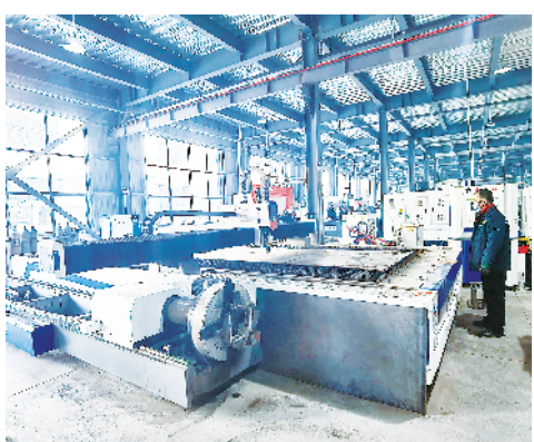
周口金辉机械制造有限公司年产5000套纺织机械设备及配件生产线建设项目。