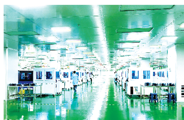
中芯微周口半导体有限公司半导体芯片测试、烧录项目。