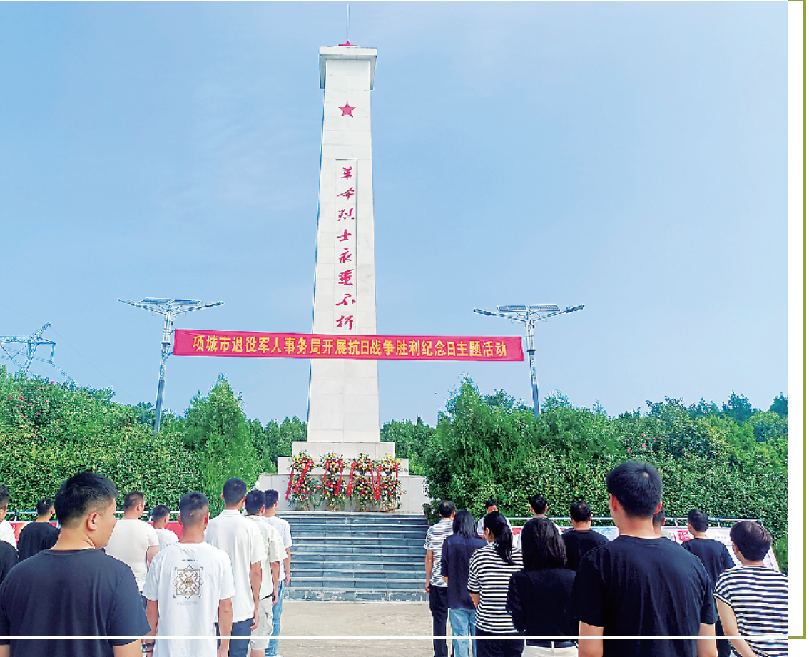
项城市退役军人事务局开展抗日战争胜利纪念日活动

(上接第一版)去年12月份举办的《周口历史文化典籍丛书》首发仪式上,全市750处公共阅读空间免费获赠8类2.5万册图书;市内外60多位学者、作家近5年来累计向全市捐赠图书10万多册……从城市图书馆到“农家书屋”,从氤氲着墨香的实体书到触手可及的电子书,形式多样的阅读方式让书香周口建设工作迈上了新台阶。