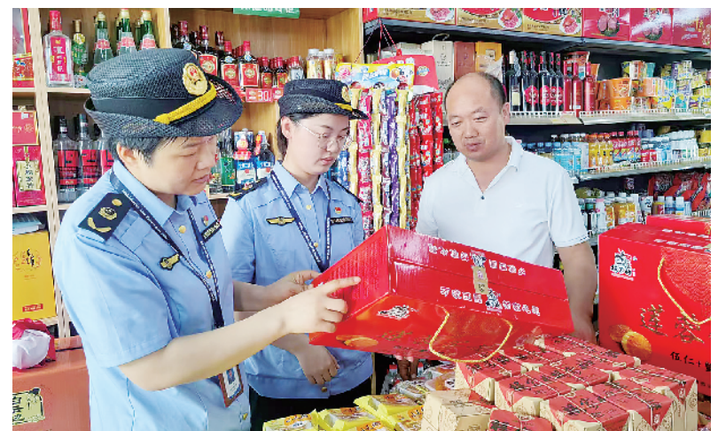
中秋佳节将至,为维护安全放心消费环境,河南省周口市市场监管局港区分局执法人员深入辖区超市开展月饼专项检查,重点查看进货台账、产品标识、有无过度包装等行为,确保广大市民在节日期间安全放心享用月饼。图为9月4日,该局执法人员对辖区内一家超市月饼经营情况开展检查。

运发展与枢纽经济建设需要,认真学习芜湖市完善干线航道网和港口功能经验,吸收在机制、管理、科技方面的创新成果,切实把学习成效转化为加快推动我省内河航运高质量发展提供借鉴。同时,加强与安徽省及芜湖市交通运输部门、航运物流企业的沟通联络,建立长期友好合作关系,在项目、资金、人才等资源上深化双向交流互动,放大跟班学习效应。