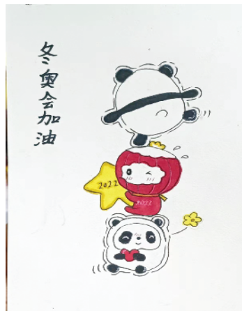
小记者:温子柔 证号:211069 周口闫庄小学三(1)班