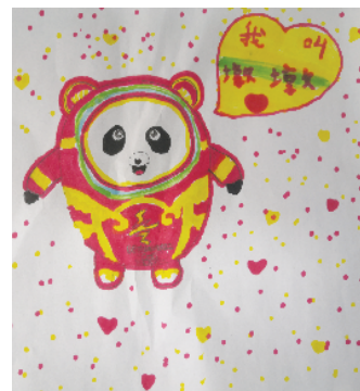
小记者:黄立言 证号:220695 周口闫庄小学二(1)班