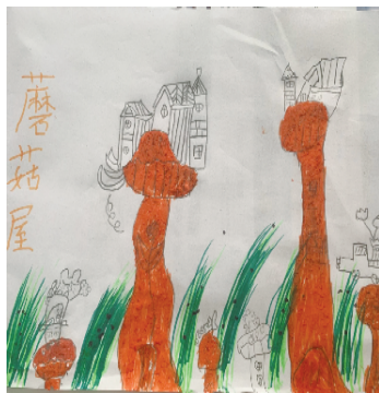
小记者:薛华磊 证号:221708 周口七一路一小一(3)班