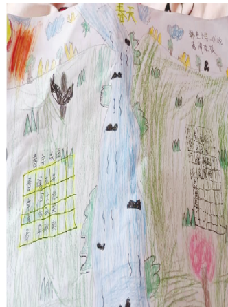
小记者:潘周依依 证号:222953 周口韩庄小学一(1)班