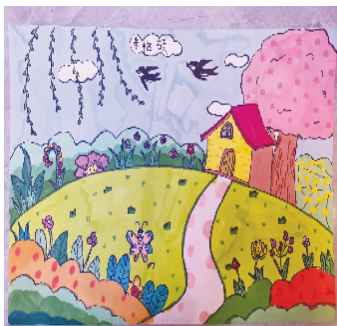
小记者:朱梓硕 证号:221688 周口七一路一小一(1)班 (辅导老师:任雅君)

本栏目刊发小记者的书法、绘画、摄影等作品。小记者如果有这些爱好,快快行动起来吧!作品完成后,请用相机拍下来并发送到 zkwbxjz@126.com。