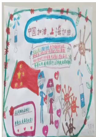
小记者:刘芳泽 证号:220728 周口闫庄小学二(8)班 (辅导老师:孙彩艳)