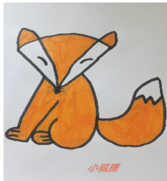
小记者:周诗雅 证号:221062 周口六一路小学一(4)班