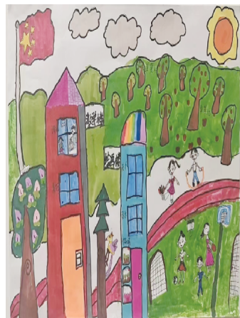
小记者:韩沛蓁 证号:222014 周口市文昌小学一(13)班 (辅导老师:沈娜)