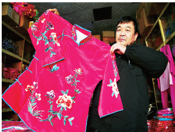
过去的戏服刺绣多为蚕丝线做成。