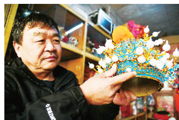
过去用蚕丝线扎花边的戏帽。